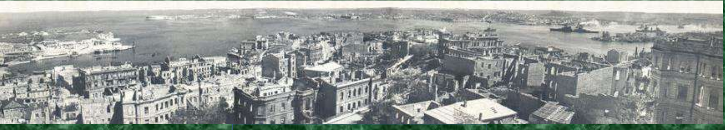
Панорама разрушенного Севастополя в день освобождения 9 мая 1944 г.

Черниговский судебный процесс Проходил с 17 по 25 ноября 1947 г. в городском кинотеатре имени Шорса. Пред судом предстали 13 венгерских и 3 немецких военнослужащих. Все их судили за преступления, совершенные на советской оккупированной территории: уничтожение гражданского населения под предлогом борьбы с партизанами, истребление советских военнопленных, разрушение населенных пунктов, грабежи. Военные преступления, рассмотренные на Черниговском процессе, были совершены как в Черниговской области, так и в прилегающих к ней областях РСФСР и Белорусской ССР.