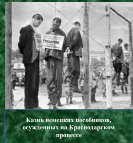
Казнь немецких пособников, осужденных на Краснодарском процессе

Приговор был приведен в исполнение 18 июля 1943 г. в 13 часов на центральной площади Краснодара. На приговорённых к высшей мере наказания висели таблички «Казнен за измену Родине». На площади присутствовало около 50 тысяч человек.