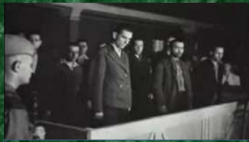
Подсудимые во время оглашения приговора

Процесс освещался советскими и зарубежными СМИ. В числе корреспондентов был писатель Алексей Толстой. Британскую службу ВВС представлял Александр Верт. Среди публики были и представители Советской армии. Например, знаменитый уже к тому моменту лётчик, герой Советского Союза, Александр Покрышкин, который воевал на Северо-Кавказском фронте.