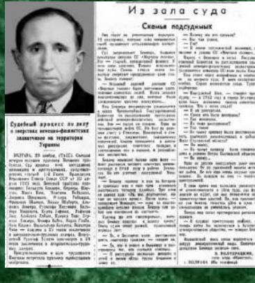
Судебный процесс на фоне восточной территории Украины