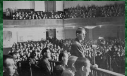
Подсудимый дает показания

Приговором Военного трибунала Ленинградского военного округа от 4 января 1946 г. под председательством полковника юстиции П.Н. Комлева установлено, что по приказу Ремингера в конце 1943 г. и начале 1944 г. во время карательных операций в деревнях Пикадижа, Замолки, Заборове, поселке Карамышево было расстреляно в общей сложности 900 и заживо сожжено 239 мирных жителей; угнано в немецкое рабство 25 000 чел., сожжено 145 деревень, имущество разграблено. Преступные приказы о расстрелах отдавал и капитан К. Штроффин, он лично уничтожил около 200 чел. Остальные девять подсудимых были расстреляны исполнением приказов - расстреливали и жгли заживо стариков, детей, женщин. Лейтенанты, фельдфебеля, рядовые Э. Скотки, Г. Янке, Э. Герер, Э. Фогель, Э. Визе, А. Дюре - каждый лично убил от 11 до