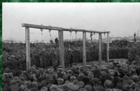
Место казни. Площадь Победы, г. Рига