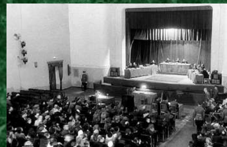
Общая панорама Севастопольского судебного процесса