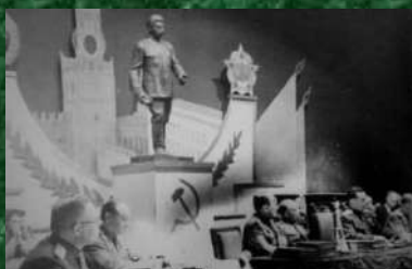
Ленинградский судебный процесс. 1946 г.

Огромная Ленинградская область (до войны в нее входили нынешние новгородские и псковские земли) интересовала нацистов лишь как «Ингерманландия» (историческая область на северо-западе современной России - владение Швеции эпохи великодержавия, существовавшее на основе Плюсского перемирия с 1583 по 1595 гг.), будущая зона немецкой колонизации. Соответственно, по плану «Одленбург» советские города, предприятия и жители обречались на уничтожение и вымирание.