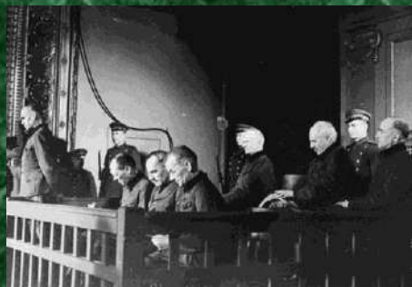
Военные преступники на скамье подсудимых

Пауль Кайбель - гауптштурмфюрер СС, с июля 1942 г. по апрель 1944 г. командовал частями СС и полиции Евпаторийского округа. Исполняя приказы военного команданта Евпатории, Кайбель организовал расстрелы около 500 местных жителей, осуществлял реквизицию их имущества. 2 мая 1944 г. водами путем из Севастополя в Констанцу