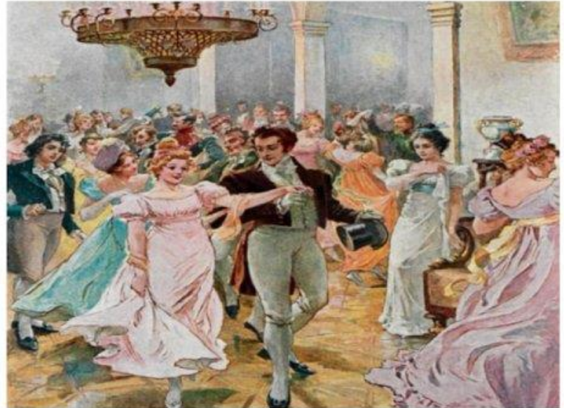
Онегин и Ольга Ларина на балу

Мы все учились понемногу Чему-нибудь и как-нибудь, Так воспитаньем, слава богу, У нас немудрено блеснуть.